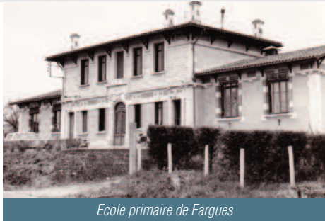
Ecole primaire de Fargues

Inutile de préciser que le Bourg de FARGUES,